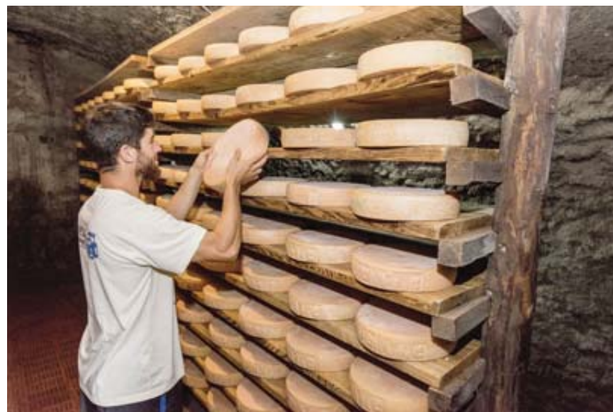
L'objectif du projet Interreg Typicalp est d'améliorer les revenus des fromagers dans les alpages valaisans et valdôtains.

Le projet Interreg Italie-Suisse Typicalp est réalisé en collaboration avec de nombreux partenaires. Côté suisse, on citera la HES-SO Valais-Wallis (Instituts technologie du vivant, informatique de gestion, entrepreneuriat & management), le Service cantonal de l'agriculture et des entreprises privées. Côté