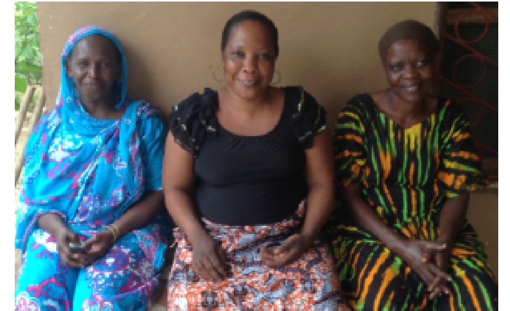
The Cleaning Mamas